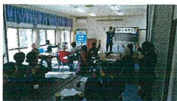
シナプソロジー体験会