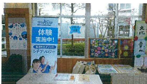
地域の健康フェア