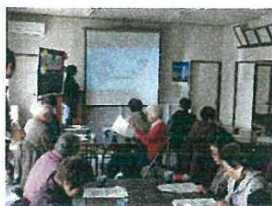
お薬・健康講座 （この日は感染症予防）