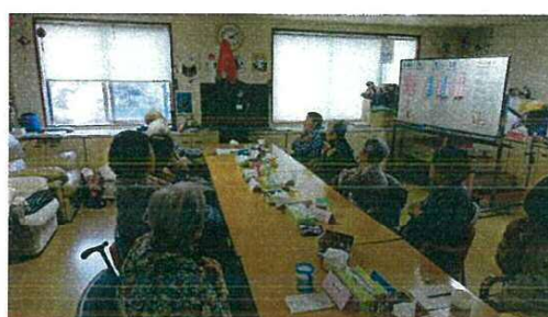
高齢者施設でのイベント